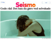
Seismo Gode råd: Det kan du gøre ved selvske