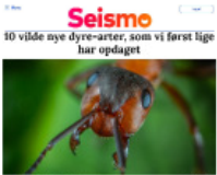
Seismo 10 vilde nye dyre-arter, som vi først lige har opdaget