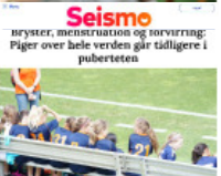
Seismo bryster, menstruation og forvring: Piger over hele verden går tidligere i puberteten