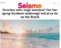
Seismo Hvordan taler unge sammen? Det har sprog-forskere undersøgt ved at se fx on the Beach