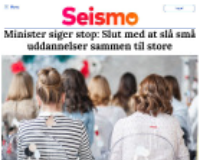
Seismo Minister siger stop: Slut med at slå små udlændinge sammen til store