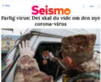
Seismo Farlig virus: Det skal du vide om den nye corona-virus