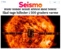
Seismo "kum-sonde senat arsted most Soten": Skal tage billeder i 500 graders varme