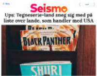
Seismo Upe: Tegneserie-lænd sneg sig med på liste over lande, som handler med USA