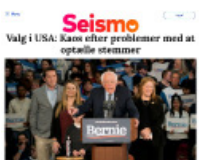
Seismo Valg i USA: Kans efter problemer med at optælle stemmer