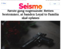
Seismo Første gang nogensinde: Retten bestemmer, at banden Loyal to Familia skal opløses