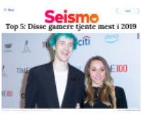
Seismo Top 5: Disse gamers tjente mest i 2019