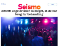
Seismo 30.000 ungs erindringer er meget, at de har brug for behandling