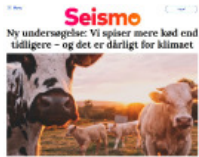
Seismo Ny undersøgelse: Vi spiser mere end tidligere – og det er dårligt for klimaet