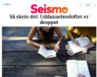
Seismo Så skete det: Uddannelsesloftet er droppet