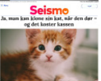
Seismo Ja, man kan kløne sin kat, når den dør – og det koster kassen