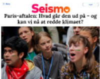
Seismo Paris-aftalen: Hvad går den ud på – og kan vi nå at redde klimaet?