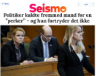
Seismo Politiker kaldte fremmed mand for en "perker" – og hun fortryder det ikke