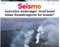
Seismo Australien undersøger: Hvad betød klima-forandringerne for brande?