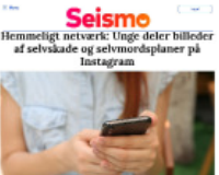
Seismo Hemmeligt netværk: Unge deler billeder af selvske og selvmordsplaner på Instagram