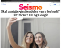
Seismo Skal ansigts-genkendelse være forbudt? Det mener EU og Google