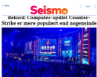
Seismo Rekord: Computer-spillet Counter-Strike er mere populært end nogensinde