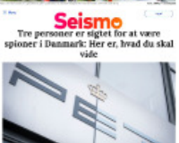
Seismo Tre personer er sigtet for at være spioner i Danmark: Her er, hvad du skal vide