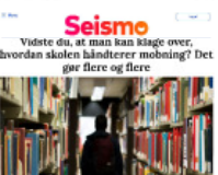
Seismo Vidste du, at man kan kløge over, hvordan skolen håndterer mobning? Det gør flere og flere