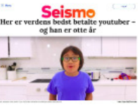
Seismo Her er verdens bedst betalte youtuber – og han er otte år