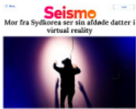
Seismo Mor fra Syd-Korea ser sin afdøde datter i virtual reality