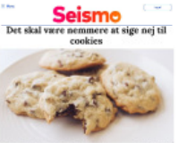
Seismo Det skal være nemmere at sige nej til cookies