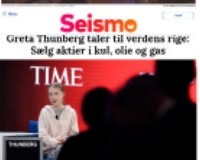
Seismo Greta Thunberg tager til verdens riges: Sælger aktier i kul, olie og gas