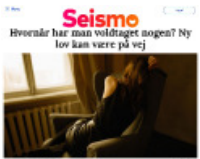
Seismo Hvorfor har man voldtaget nogen? Ny lov kan være på vej