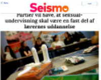
Seismo Partier vil have, at seksual-undervisning skal være en fast del af lærerens uddannelse