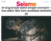
Seismo 19-årig kvinde måtte droppe forsvaret – hun måtte ikke have muslimsk tørklæde på