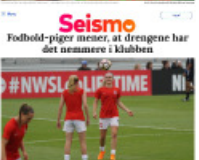
Seismo Fodbold-piger meser, at drengene har det annerledes i klubben