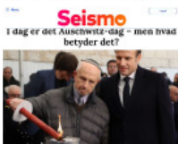
Seismo I dag er det Auschwitz' dag – men hvad betyder det?