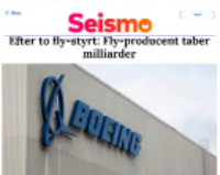
Seismo Efter to by-styr: Fly-producent taber milliarder