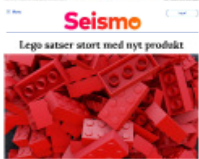
Seismo Lego sætter stort med nyt produkt