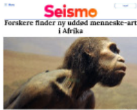
Seismo Forskere finder ny uddød menneske-art i Afrika