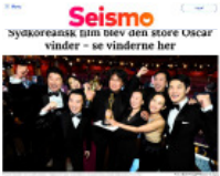
Seismo Sydkoreansk, tim blev den store Oscar-vinder – se vinderne her