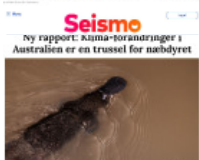
Seismo Ny rapport: Klima-tilpasninger i Australien er en trussel for nabystret