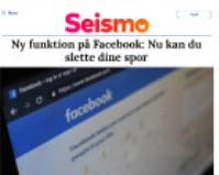
Seismo Ny funktion på Facebook: Nu kan du slette dine spor