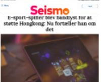
Seismo I-sport-spiller blev uansynlig: Nu støtter Hongkong. Nu fortæller han om det